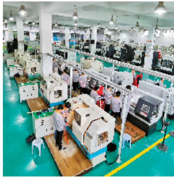
温州职业技术学院先进制造创新技术实训基地。

“接下来我省将进一步完善现代职业教育体系,将职业教育摆入服务高质量发展建设共同富裕示范区,形成与我省经济社会发展紧密结合的职业教育发展新格局。”省教育厅职教处相关负责人表示。