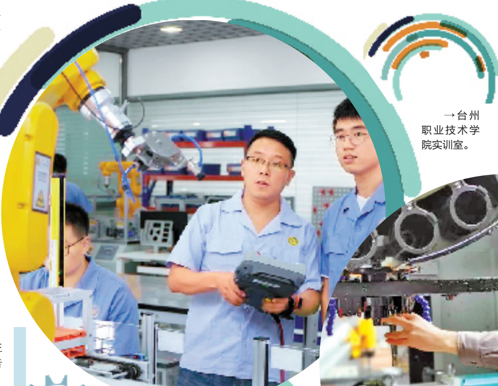
台州职业技术学院实训室。

省教育厅职教处相关负责人表示,接下来将按照国家部署,畅通职业教育学生成长成才通道,积极推进本科层次职业教育,扩大面向中职招生规模,让职业教育的升学通道更加畅通。